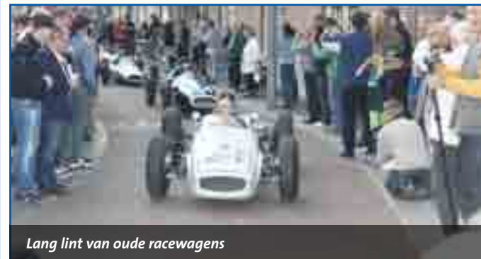
Lang lint van oude racewagens

Werkelijk duizenden raceliefhebbers en liefhebbers van historische auto's hebben zaterdagavond kosten nog moeite gespaard om van de parade met historische raceauto's te genieten. De chauffeurs moeten zich ware helden gevoeld hebben toen ze door drommen mensen naar het centrum van Zandvoort reden.